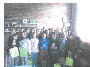
Remise des dictionnaires au CM1 de l'école le 16 octobre