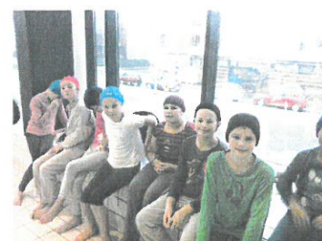
Test Voile à la piscine Paul Asséman le 14 novembre