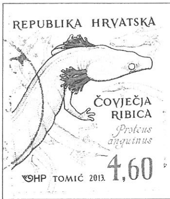
Un timbre croate avec un protéé

Le protéé est un animal aquatique carvenicole 1 très rare qui ne vit que dans des grottes dans les Alpes dinariques 2 en Slovénie, en Croatie et en Bosnie. La découverte du protéé est assez récente. On l'appelle aussi « salamandre blanche » car il appartient à la même famille, celle des tritons. C'est donc un ovipare 3 . Il peut vivre jusque cent ans !