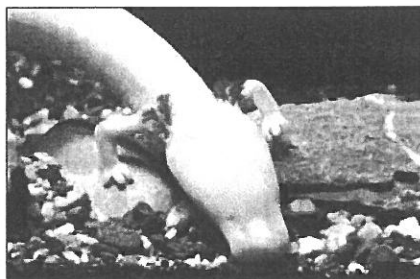
De chaque côté de la tête, les branchies

Le protéé a des branchies 6 pour respirer l'oxygène de l'eau.