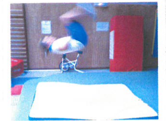
Comment Lila va-t-elle atterrir ?