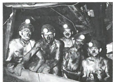
Les « gueules noires » dans les anciennes mines de la région Nord-Pas-de-Calais

- une énergie secondaire, l'électricité ; on dit « secondaire » parce qu'il faut une autre source d'énergie pour la produire. Dans le monde, les énergies utilisées sont dans l'ordre : le pétrole (34%), le charbon (26%), le gaz (23%), les énergies renouvelables (10%) et l'énergie nucléaire (7%).