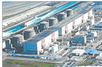
La centrale nucléaire de Gravelines

- l'énergie atomique : centrales nucléaires.