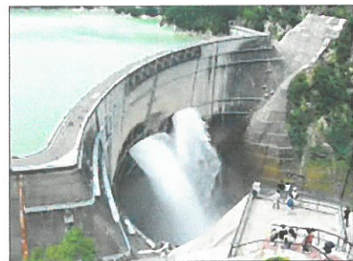
Un barrage hydroélectrique

- la force de l'eau : barrage hydroélectrique en montagne, usine marémotrice ;