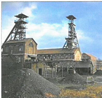
Le « carreau » de la mine et les chevalements

- les énergies fossiles : le charbon (fossile de forêts préhistoriques); le pétrole (fossiles d'animaux et de plantes aquatiques); ce sont des énergies qui s'épuisent et sont de plus très polluantes ;