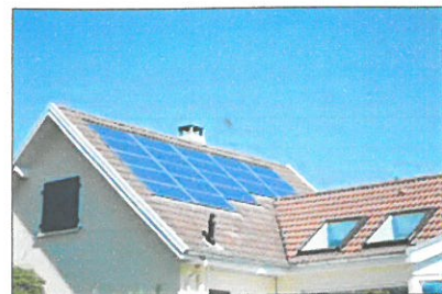
Des panneaux solaires sur le toit d'une maison

- la force du soleil : énergie solaire ;