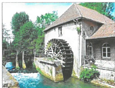
Le moulin à eau est actionné par le courant de la rivière.

On utilise trois sources d'énergie principales : - les énergies naturelles : le vent, la force de l'eau des rivières ou des marées, le soleil... qui sont renouvelables et inépuisables ;