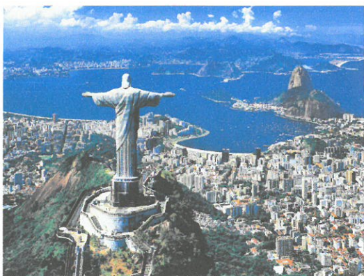
Baie de Rio de Janeiro

Il s'agit de l'événement touristique le plus important de la municipalité de Rio, étant devenu un vrai synonyme de la célébration du Carnaval dans le pays et même au monde.