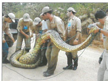
Anaconda, serpent constricteur géant !

L'Amazonie est peuplée de très nombreux animaux. Certains sont dangereux, comme l'anaconda qui peut mesurer jusqu'à 10 m de long. On peut aussi trouver des piranhas qui sont des poissons carnivores.