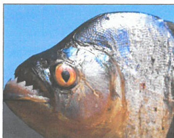
Piranha, poisson carnivore féroce !