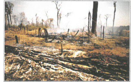
Espace ravagé par une déforestation par le feu, pour gagner des terres agricoles