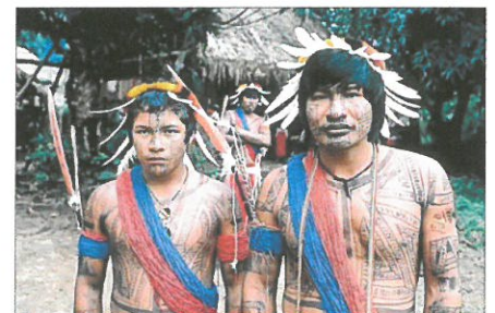
Peuple amérindien de la forêt amazonienne

Dans la forêt vivent des peuples amérindiens, dont certains sont peut-être encore inconnus ! La destruction de la forêt peut entraîner la disparition de ces peuples. Le célèbre chef Raoni lutte pour leur défense.