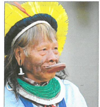
Le chef Raoni

Lors d'une visite en Europe, Raoni a fait un discours à Strasbourg pour demander de l'aide, car le Brésil veut construire un énorme barrage, et pour le construire, il faudra déboiser une partie des terres de son peuple :