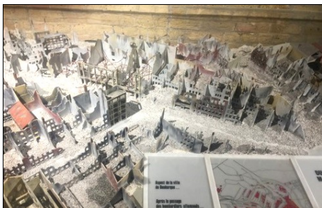
La maquette de Dunkerque en ruines