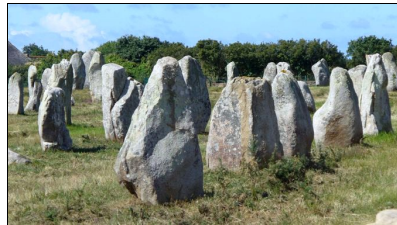
Les menhirs à Carnac