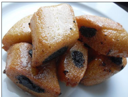
Les « makrouts »...