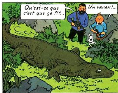
Le varan, ou « Dragon de Komodo » (Tintin, « Vol 714 pour Sidney »)