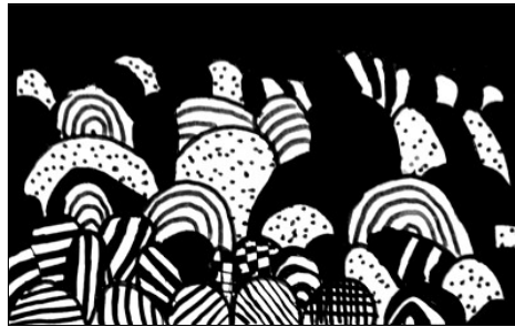
Graphisme de Jordan