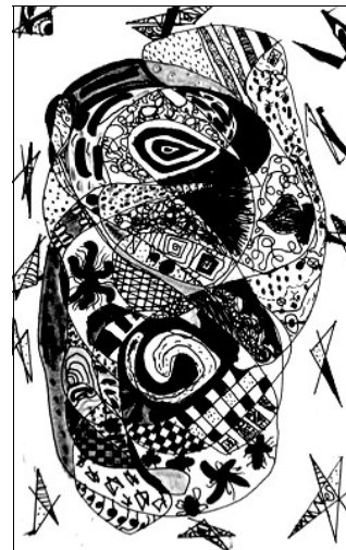
Graphisme de Lou