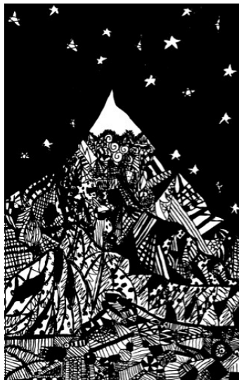
Graphisme de Yol