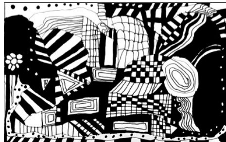
Graphisme de Timothée