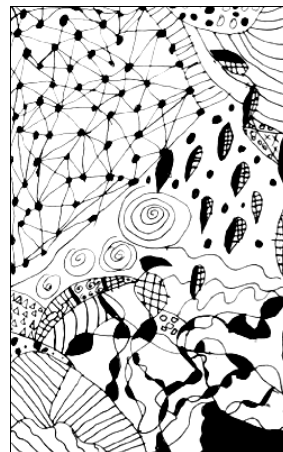
Graphisme de Donovan