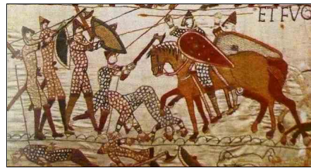
Tapisserie de Bayeux