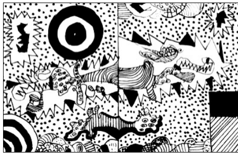
Graphisme de Sarah