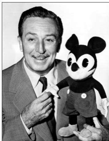
Walt Disney (1901-1966)