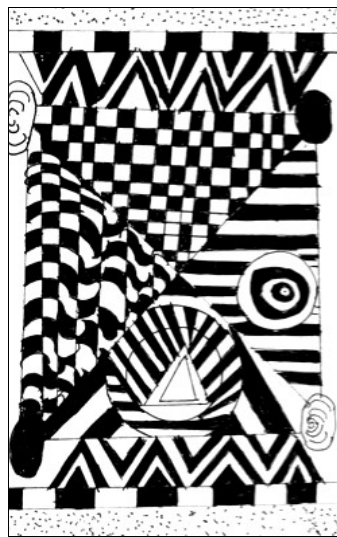
Graphisme de Kilian W.