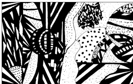
Graphisme de Donovan