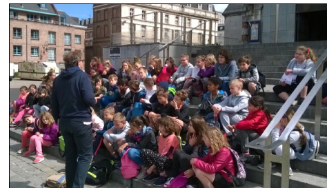
Visite historique de Lille le matin