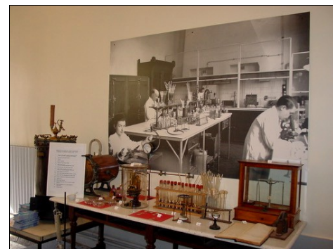
L'après-midi, visite à l'Institut Pasteur pour un groupe...