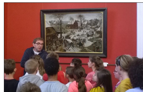
... et au musée des Beaux-Arts pour l'autre groupe.