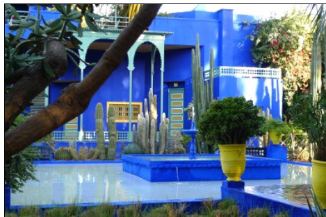
Le jardin de l'artiste peintre Jacques Majorelle