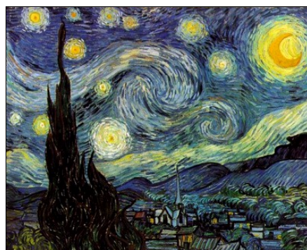
Tableau de Vincent Van Gogh