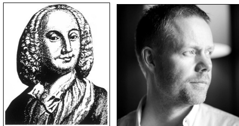
Antonio Vivaldi et Max Richter

Nous avons présenté par groupes nos chorégraphies par groupes sur « Hon Hirabe » pour shakuhachi. Nous avons ensuite découvert une nouvelle musique, un extrait des « Quatre saisons » de Vivaldi « recomposées » par Max Richter.