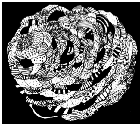
Graphisme de Sarah