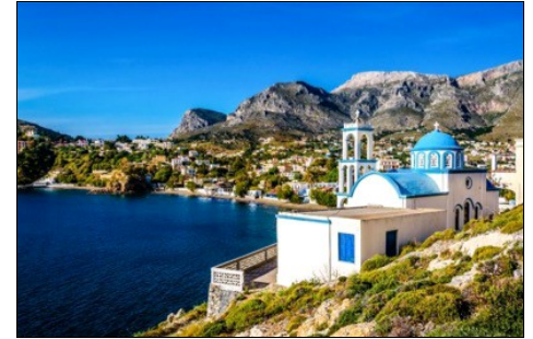
L'île de Kos