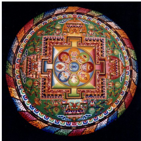
Un « vrai » mandala