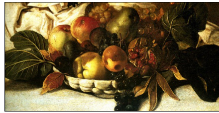
Corbeille de fruits par le peintre Le Caravage

Moi, j'aimerais être un arbre, avec des fruits de toutes les couleurs, des fruits rouges, jaunes, orange, bleus, verts, noirs, brillants... De tous les parfums, puissants ou discrets, capiteux ou frais, floraux ou herbacés... De toutes les formes, sphériques, oblongs, cubiques... De tous les goûts, acides, sucrés, salés, poivrés, doux... De toutes les textures, juteux, croquants, moelleux, fondants... Je pousserais au milieu du jardin public, comme ça, tout le monde viendrait m'en cueillir. Je serais plus haut que la Tour Eiffel parce qu'on m'arroserait tout le temps. Mon tronc serait imposant comme un phare indestructible dans la tempête, ma ramure majestueuse comme la charpente d'un château, mon feuillage touffu comme la chevelure d'un géant ! Je serais époustouflant !