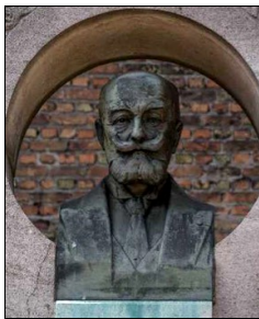
La statue de Félix Coquelle

Nous avons commencé un exposé, tous le même pour bien savoir comment on fait, sur « Notre école ».