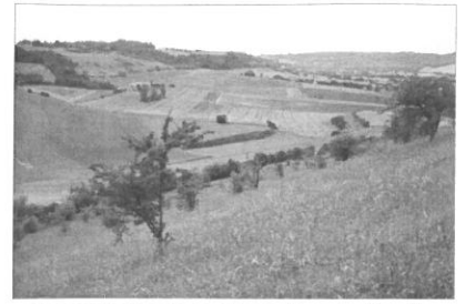
Un paysage de collines dans la Sarthe

Un plateau est aussi une étendue plate, mais souvent plus en altitude, et où les rivières sont encaissées au fond des vallées.