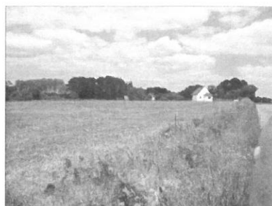
Un paysage de plaine en Vendée

Un plateau est aussi une étendue plate, mais souvent plus en altitude, et où les rivières sont encaissées au fond des vallées.