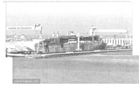
Chantiers de construction navale à Saint-Nazaire

Les activités de la région sont le tourisme, surtout au bord de la mer, l'agriculture, la pêche et l'industrie (construction navale à Saint-Nazaire).