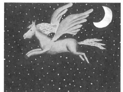
Gouache 50 x 60 de Fantine