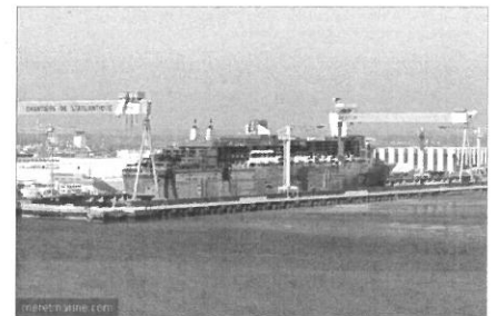
Chantiers de construction navale à Saint-Nazaire

Les activités de la région sont le tourisme, surtout au bord de la mer, l'agriculture, la pêche et l'industrie (construction navale à Saint-Nazaire).