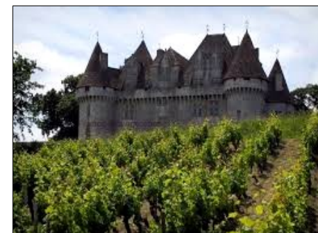
Vignoble du Périgord

La viticulture, avec les vignobles, est aussi une grande pourvoyeuse d'emplois et de création de richesses, et une véritable attraction touristique.