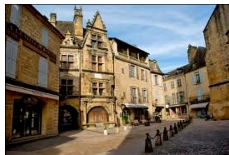
Une ville très touristique du Périgord : Sarlat

En 2012, le tourisme représente 21 % de la richesse du département grâce surtout aux visiteurs anglais, amateurs de cuisine française.