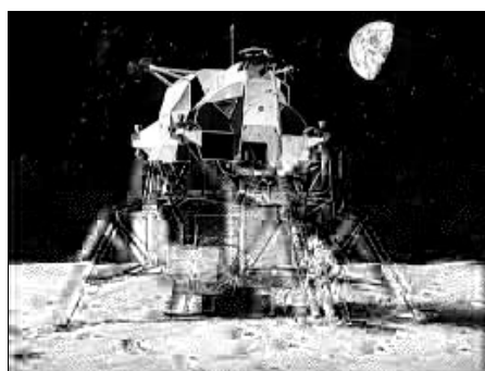
Le LEM posé sur le sol lunaire

Pour descendre sur la lune, les astronautes ont utilisé le LEM.