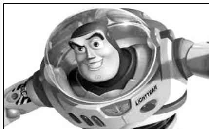
Edwin Aldrin a servi de modèle pour Buzz l'Eclair !

Neil Armstrong a embarqué à bord du vaisseau Apollo avec deux autres astronautes ; Mickael Collins et Edwin « Buzz » Aldrin (le modèle de « Buzz l'Eclair » !).