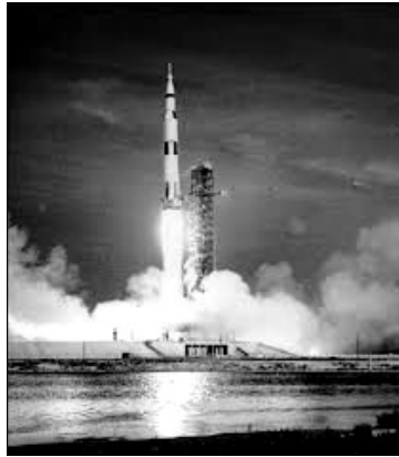
Le départ de la fusée Saturne V

fusée assez puissante pour sortir de l'attraction terrestre : Saturne V. Il y a 400 000 Km entre la terre et la lune ; il faut quatre jours pour y aller.