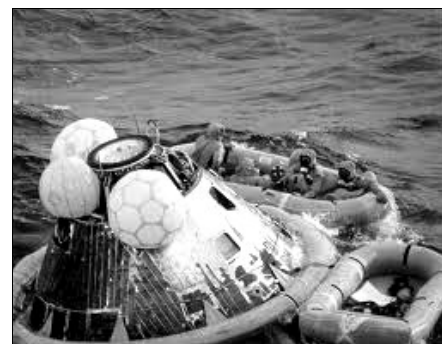
Le retour de la cabine Apollo XI

De retour sur terre, les astronautes ont été fêtés comme des héros !