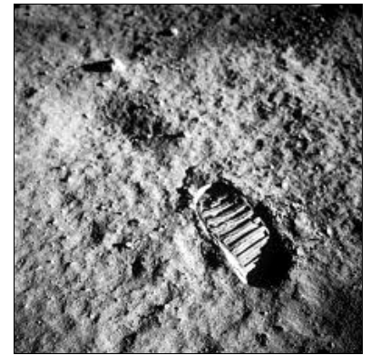
Une empreinte de pas de Neil Armstrong dans la poussière du sol lunaire

Armstrong et Aldrin sont restés trois heures à marcher sur la lune. Ils avaient un scaphandre spécial pour respirer et se protéger de la chaleur ou du froid. Ils ont ramassé des pierres qui ont été ramenées sur terre pour y être analysées par des scientifiques.