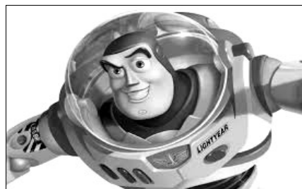
Edwin Aldrin a servi de modèle pour Buzz l'Eclair !

Neil Armstrong a embarqué à bord du vaisseau Apollo avec deux autres astronautes ; Mickael Collins et Edwin « Buzz » Aldrin (le modèle de « Buzz l'Eclair »!).