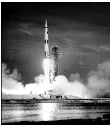
Le départ de la fusée Saturne V

fusée assez puissante pour sortir de l'attraction terrestre : Saturne V. Il y a 400 000 Km entre la terre et la lune ; il faut quatre jours pour y aller.