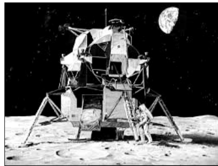
Le LEM posé sur le sol lunaire

Pour descendre sur la lune, les astronautes ont utilisé le LEM.