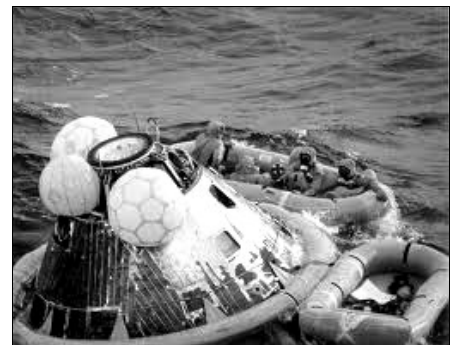
Le retour de la cabine Apollo XI

De retour sur terre, les astronautes ont été fêtés comme des héros !