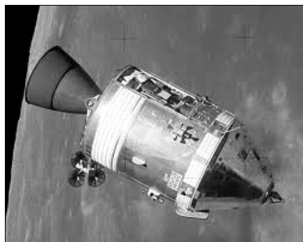
Le vaisseau Apollo XI

Les astronautes étaient, eux, dans une minuscule partie tout en haut de la fusée, la capsule Apollo XI (le seul morceau qui est revenu sur terre!).