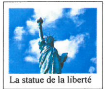
La statue de la liberté

Le World Trade Center et ses tours jumelles étaient aussi une destination privilégiée par les touristes avant le 11 septembre 2001.