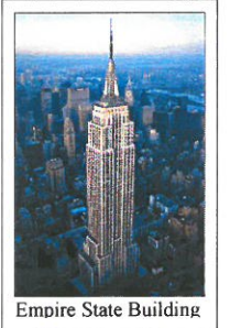
Empire State Building