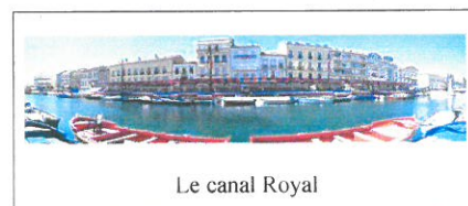
Le canal Royal

* Phares du mont Saint Clair et du môle Saint Louis