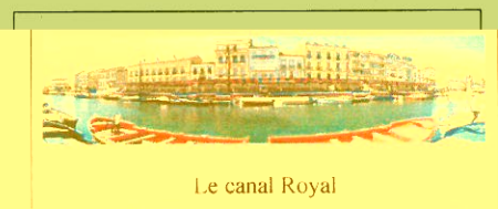
Le canal Royal

* Plaisance au mont Saint Clair et au môle Saint Louis