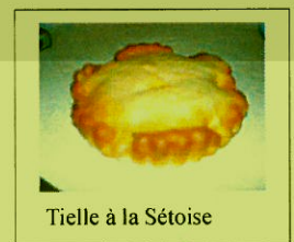
Tielle à la Sétoise

* Tielle à la Sétoise : c'est une tourte avec une garniture faite de calamars, de poulpes ou de seiches coupés, mélangée avec une sauce tomate pimentée. La pâte est généralement une pâte à pain.