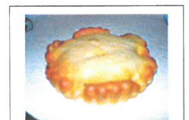
Tielle à la Sétoise

* Tielle à la Sétoise : c'est une tourte avec une garniture faite de calamars, de poulpes ou de seiches coupés, mélangée avec une sauce tomate pimentée. La pâte est généralement une pâte à pain.