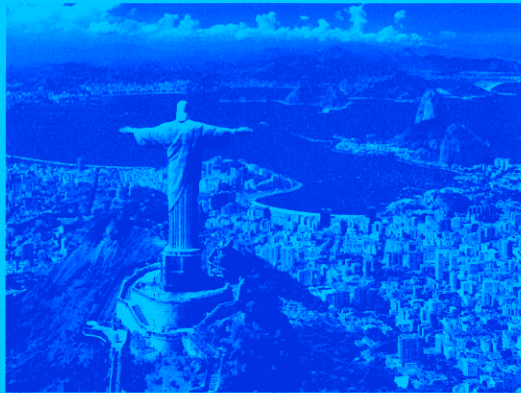
Baie de Rio de Janeiro

Il s'agit de l'événement touristique le plus important de la municipalité de Rio, étant devenu un vrai synonyme de la célébration du Carnaval dans le pays et même au monde.